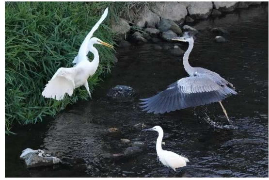
ダイサギ、アオサギ、コサギ